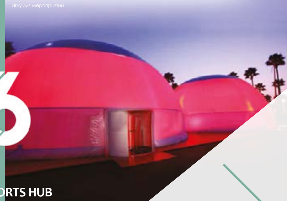
Иглу для мероприятий

Почерпнуть идеи для создания собственного уникального мероприятия можно на: www.sportshub.com.sg www.thinkoutevents.com