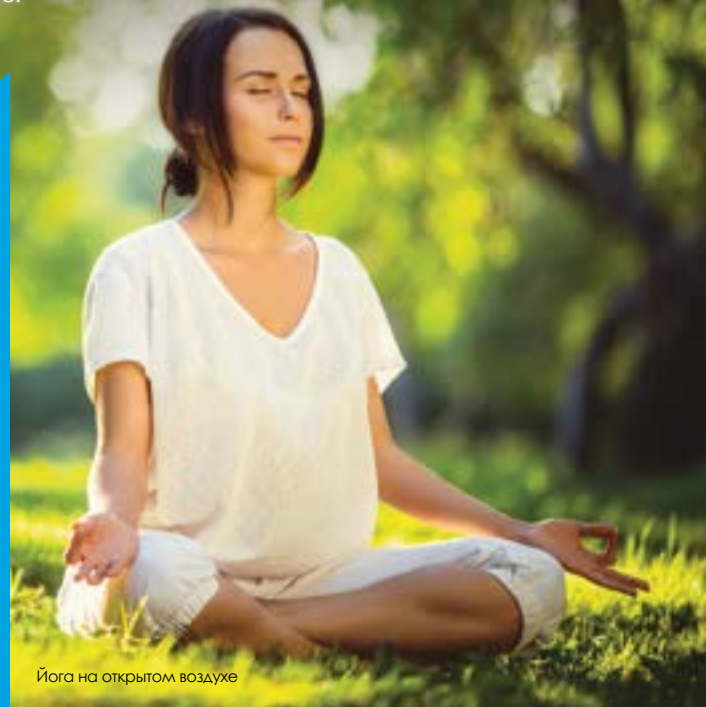
Йога на открытом воздухе

Почерпнуть идеи для создания собственного уникального мероприятия можно на: www.soulscapе.sg www.sbg.org.sg www.yoursingapore.com/see-do-singapore/nature-wildlife/parks-gardens/chinese-garden.html