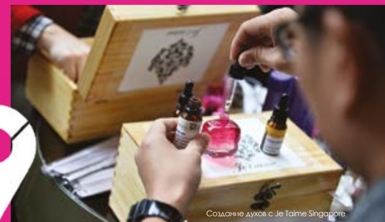
Создание духов с Je Taime Singapore