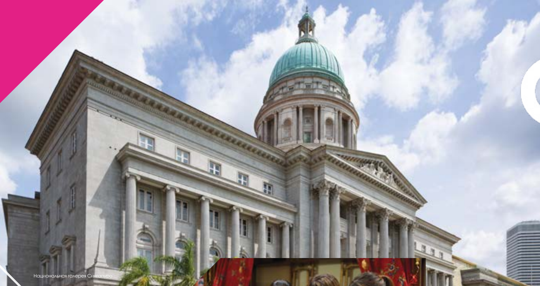
Национальная галерея Сингапура